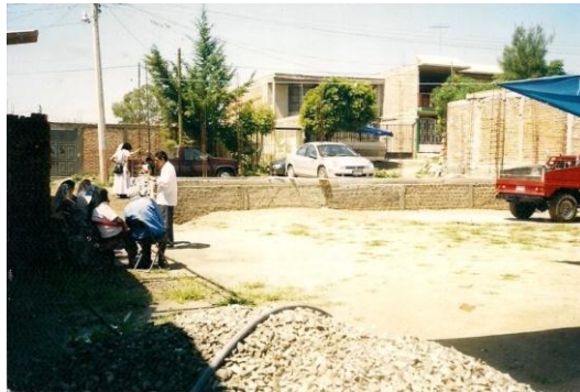
barda de frente