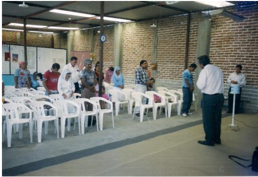
Templo con firme

En seguida se puso el firme del sanitario de mujeres y el firme provisional del templo, también se enjarro el templo y la fachada exterior.