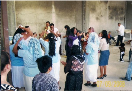
Hnos. adorando al Señor

No teníamos pila bautismal y era difícil llevar acabo los bautismos, pues algunos hermanos en ocasiones no podían asistir a estas fiestas, debido a la distancia fue entonces que tomamos la decisión de construir nuestra pila bautismal para que nadie se perdiera la bendición de ver el nuevo nacimiento de los que han de ser salvos.