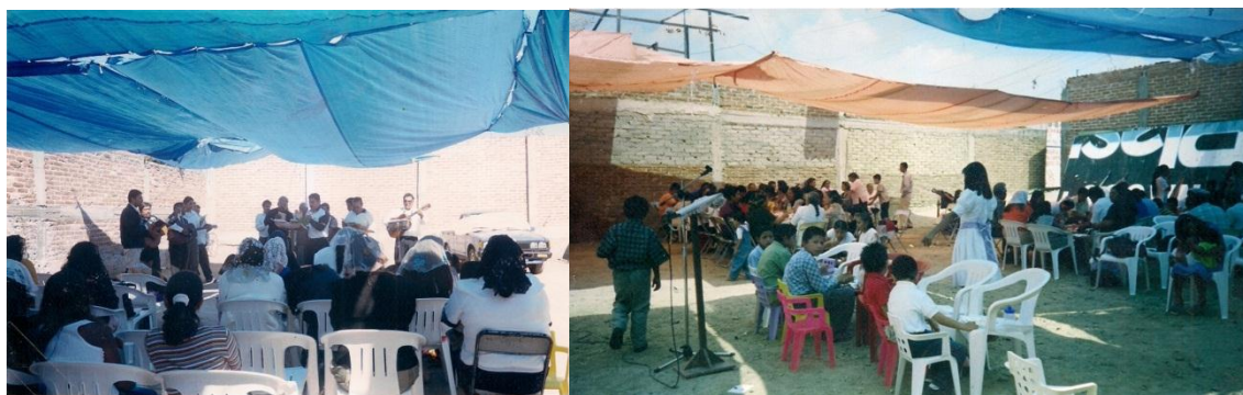
Cultos en terreno comprado por la iglesia

Los vecinos ya habían construido y con la construcción de estas bardas del templo el lugar ya estaba más seguro, pero la única manera de protegerse un poco del sol y la lluvia era a través de unas lonas que con gusto el hno. Samuel y luego el hno. Ventura Valdivia junto con uno o dos hermanos más las ponían muy temprano cada domingo y también instalaba un equipo de sonido alimentado por una batería de auto, las sillas eran trasladadas de la casa pastoral al templo y del templo a la casa cada domingo; así se llevaban a cabo con mucha alegría la escuela bíblica dominical y los cultos.