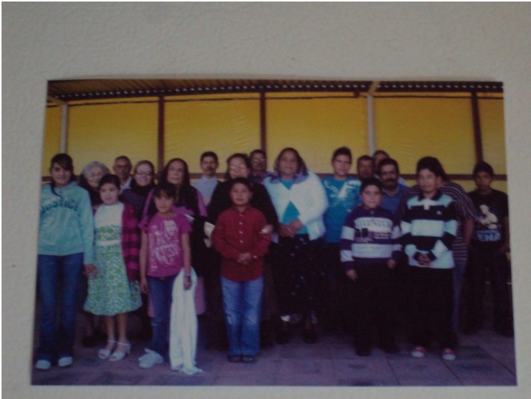
Membresía de la iglesia