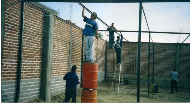
Construcción de estructura