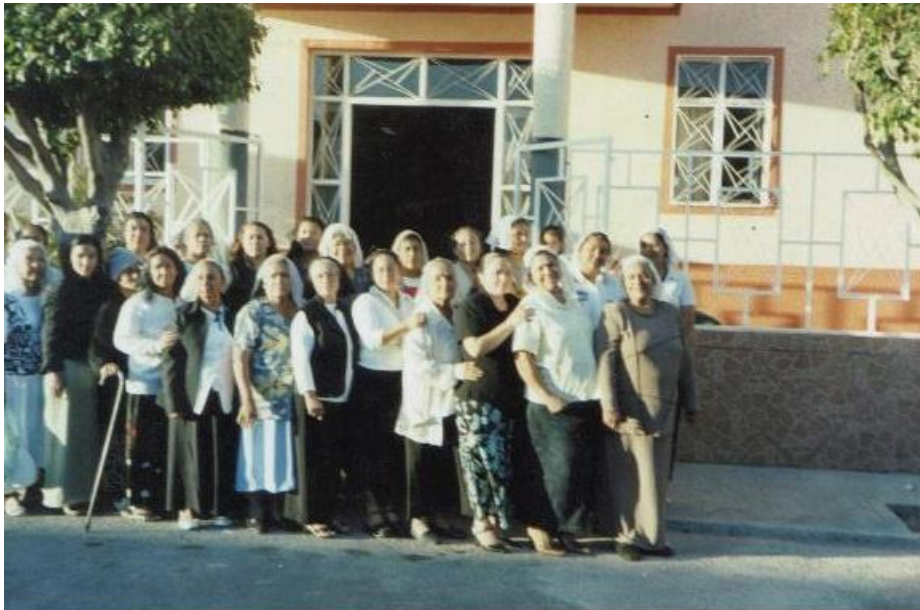
Fotografía: parte de la red de damas

Red de damas son 104 actualmente, la red de varones está conformada por 75 hermanos, la red de jóvenes por 32 y cuatro adolescentes bautizados, niños son 94 y matrimonios 57 dando un total de 215 hermanos bautizados hasta esta fecha.