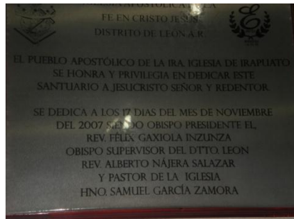
Placa develada en la inauguración del templo: