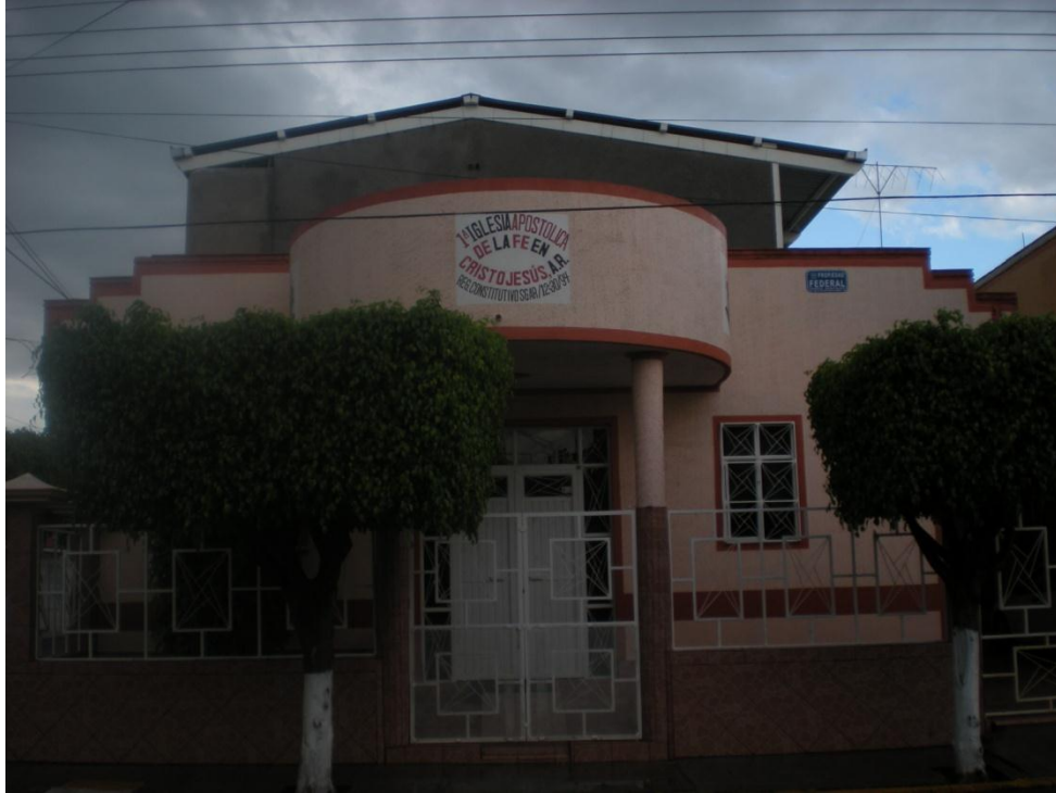
Instalaciones de la iglesia actualmente.

Como podemos observar ha sido fuerte el trabajo realizado por cada uno de los hermanos que han pasado por la administración y por la congregación tomando en cuenta por supuesto que el crecimiento lo da Dios.