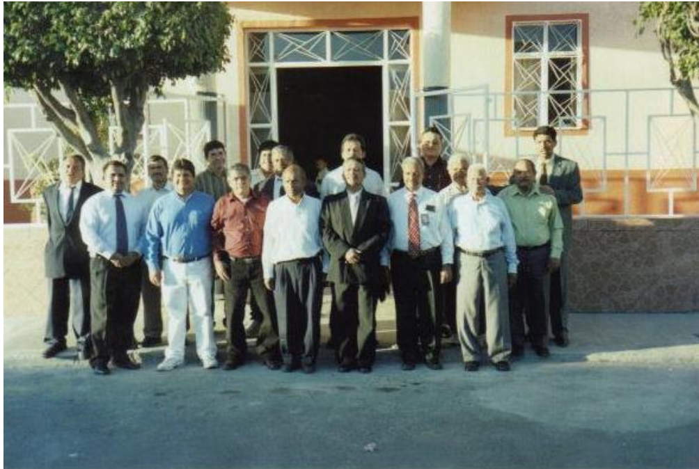
Fotografía: Parte de la red de varones