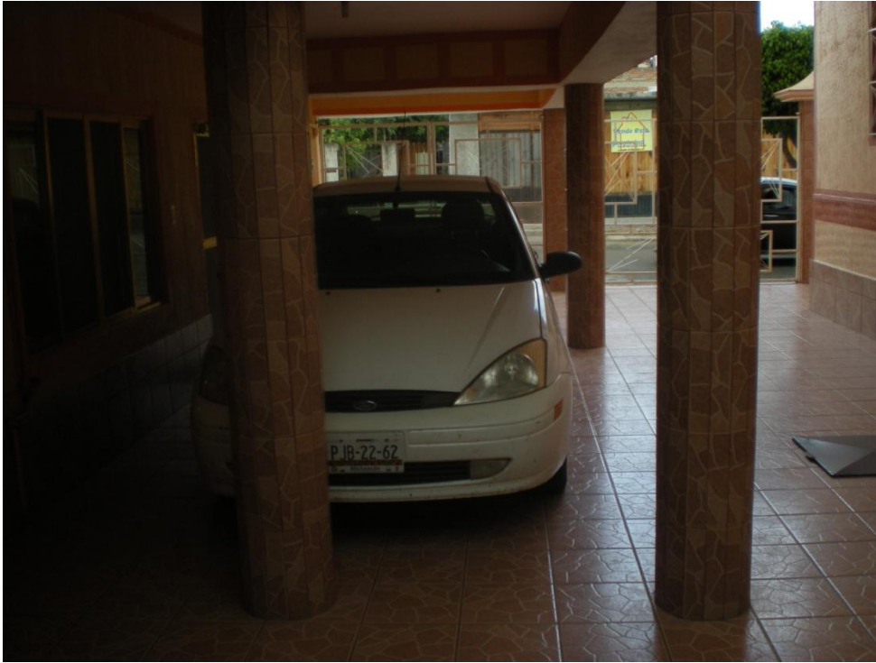
Fotografía donde se muestra el patio del templo.

Se terminó la casa pastoral colocándosele el vitropiso, el empastado, la pintura y toda la herrería de aluminio, como se observa en las siguientes fotografías 1ª y 2a.