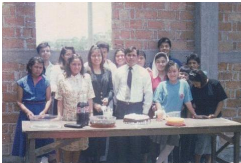
Fotografía donde se observa al pastor conviviendo con los jóvenes cuando la iglesia aún estaba en construcción.