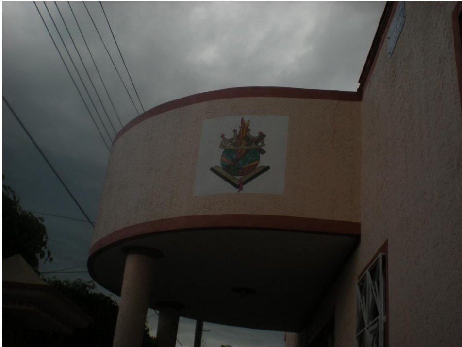
Fachada actual del templo.