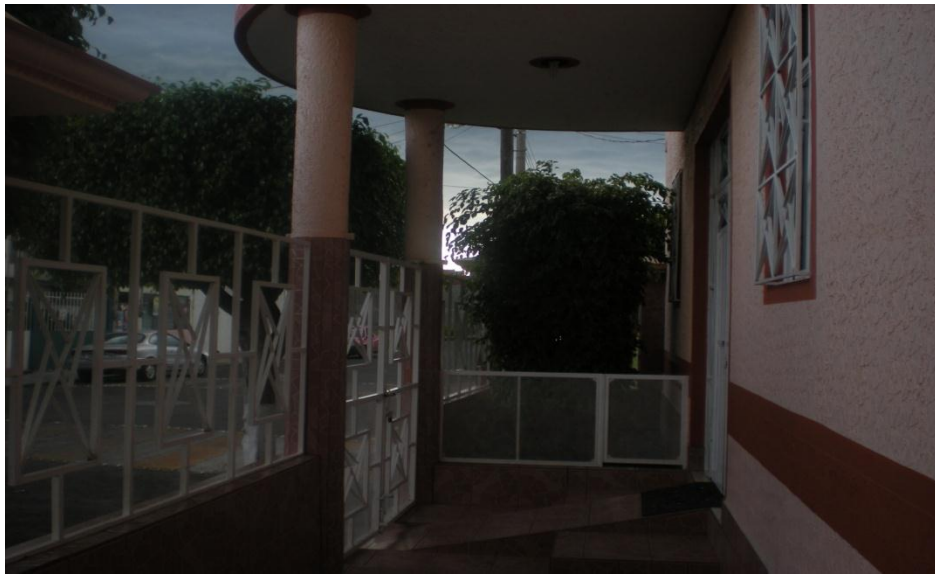
Entrada al templo.