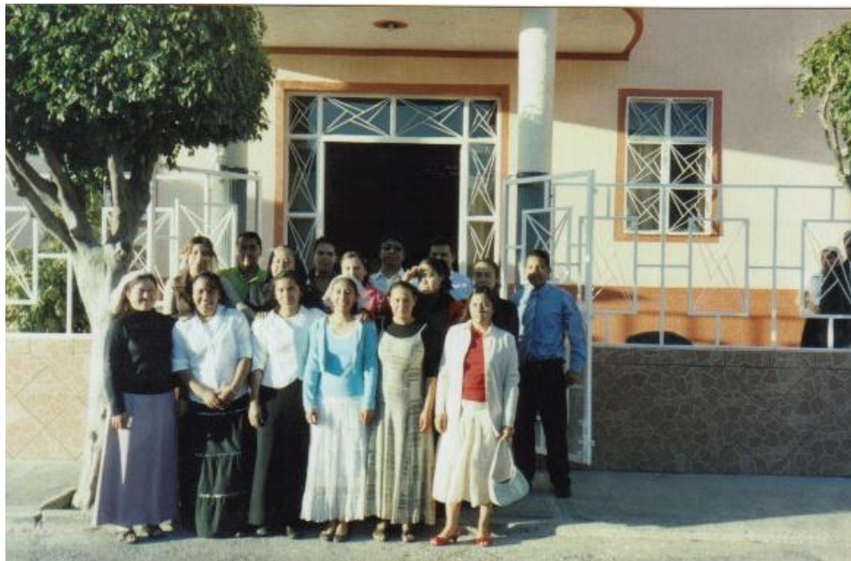
Fotografía: parte de la red de jóvenes