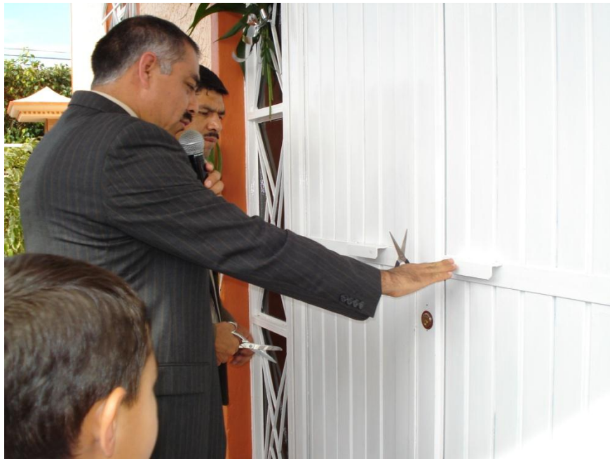
17 de noviembre del 2007 inauguración del templo.