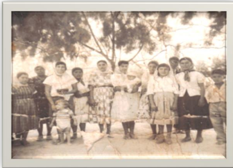
Grupo de hermanas de la 1ª IAFCJ, (1959).