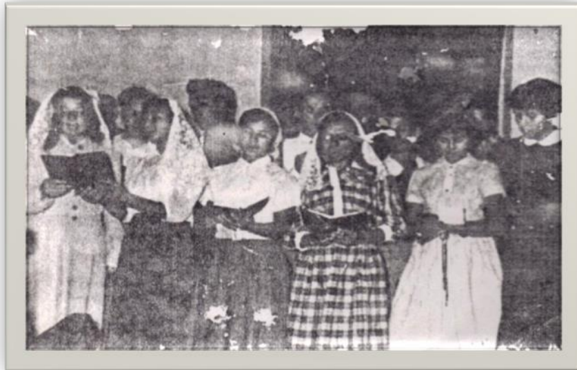
Hermanos de la mision apostolica ubicada en la brecha 120 de la 1ª. IAFCJ, participando en confraternidad de misiones de Rio Bravo, Tam. (1955-1956).