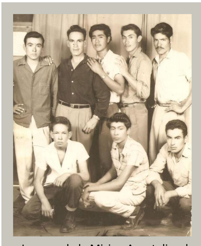
Jovenes de la Mision Apostolica de la brecha 120. (1954)