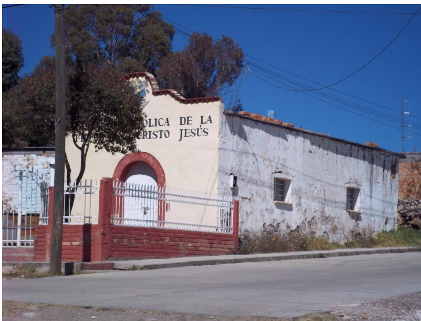
TEMPLO CONSTRUIDO EN 1973