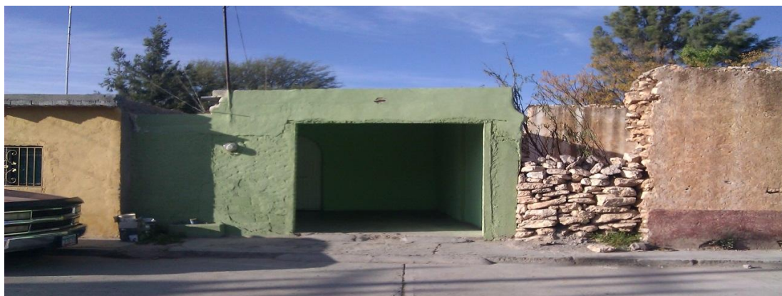
Este es el templo que se construyó, En el terreno que la Hna. Dono.